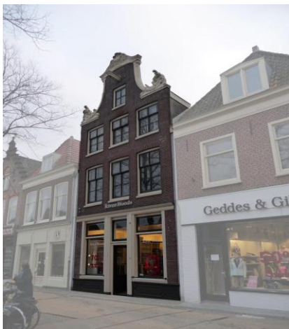
Het geboortehuis van Cornelis Drebbel , nu Verdronkenoord 141

Alkmaar is dan een stad met ca. 6000 inwoners 4 .